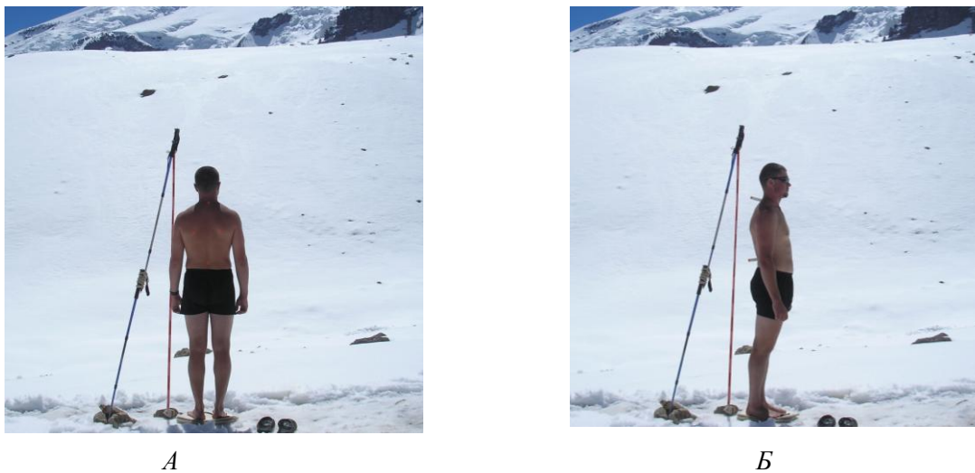
Рис. 1. Фотосъемка биогеометрического профиля осанки спортсмена (под пер. Балк-Баши) А – во фронтальной плоскости, Б – в сагиттальной плоскости

Обработка фотограмм биогеометрического профиля осанки спортсменов в сагиттальной и фронтальной плоскостях осуществлялась с помощью компьютерной программы «Торсо» [5].