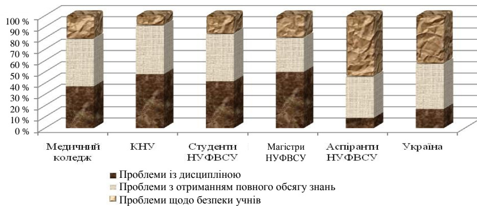
Рис. 6. Наслідки, до яких може призвести спільне навчання в загальноосвітній школі з дітьми, котрі мають відхилення розумового розвитку

У результаті досліджень виявлено, що більшість категорій респондентів відзначили головною проблемою спільного навчання виникнення значних труднощів із дисципліною. Проте аспіранти дотримуються іншої думки. Якщо всі категорії респондентів (близько 50 %) головною відзначили виникнення проблем із дисципліною, то аспіранти – значно меншою мірою (менше 10 %). Це насамперед пов'язано з тим, що аспіранти мали досвід роботи з особами, які мають відхилення розумового розвитку, та мали змогу оцінити їхні можливості. Саме тому досвід праці з цими особами вплинув на розбіжності в показниках за категоріями.