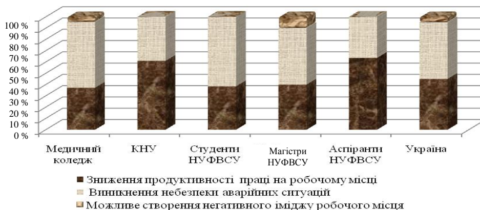
Рис. 5. Наслідки, до яких може призвести спільна праця з особами, котрі мають відхилення розумового розвитку

Проте респонденти Медичного коледжу, студенти та магістри НУФВСУ головною серед представлених проблем вважають виникнення небезпечних ситуацій. Виявлено, що студенти Медичного коледжу надають цій проблемі найбільшого значення. Це пов'язано зі специфікою діяльності медичних працівників, тобто вони побоюються, що виникнення будь-яких небезпечних ситуацій на робочому місці може призвести до значних негативних наслідків, особливо стосовно здоров'я пацієнта. Саме значна відповідальність за життя й здоров'я інших осіб – основна причина отриманих показників. Варто відзначити, що можливе створення негативного іміджу робочого місця посідає останню сходинку, що відображає загальноукраїнську тенденцію.