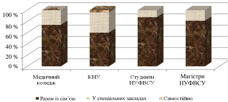
Рис. 2. Умови, у яких мають проживати особи з відхиленнями розумового розвитку

У результаті досліджень виявлено, що студентська молодь України вважає більш доцільним проживання осіб із відхиленнями розумового розвитку у своїх сім'ях, аніж у спеціальних закладах чи самостійно.