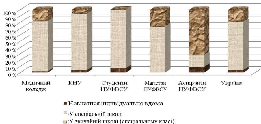
Рис. 4. Установи, де повинні отримувати освіту особи з відхиленнями розумового розвитку

Проте аспіранти НУФВСУ схильні думати, що такі особи можуть і мають право навчатись у звичайній школі. Це можна пояснити тим, що аспіранти працювали з особами, котрі мають відхилення розумового розвитку, та знають їхні можливості.