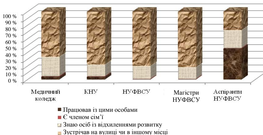
Рис. 1. Імовірні контакти респондентів з особами, які мають відхилення розумового розвитку

У результаті досліджень виявлено, що кожен із респондентів контактував з особами, які мають відхилення розумового розвитку (рис. 1). Значна частина опитаних зустрічала їх на вулиці й в інших громадських місцях (68 %), а більш ніж 25 % респондентів особисто знають осіб із такими відхиленнями та активно беруть участь у їхній соціальній інтеграції.