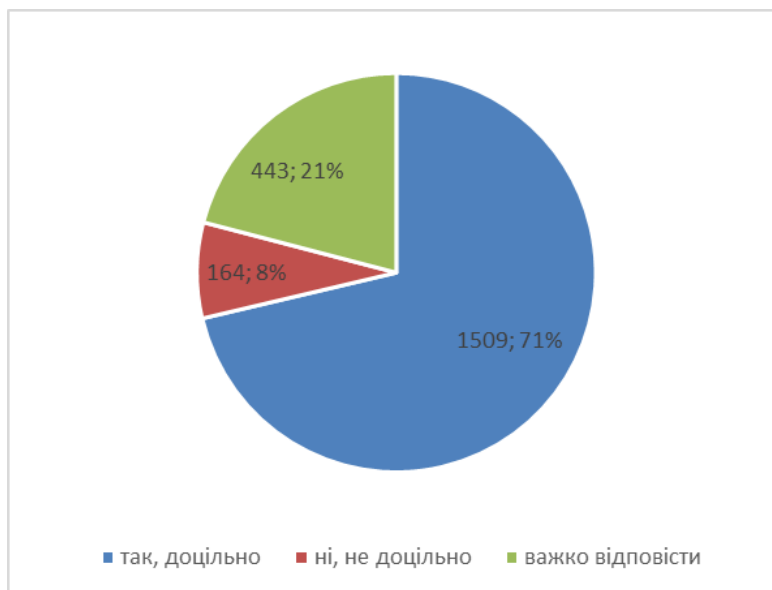
Рис. 1. Доцільність використання військово-прикладних вправ на уроках фізичної культури в школі