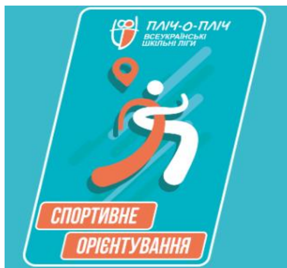
Рис. 1. Логотип Всеукраїнських змагань «Пліч-о-пліч» – всеукраїнські шкільні ліги зі спортивного орієнтування» серед учнів закладів загальної середньої освіти на 2023/2024 навчальний рік під гаслом «РАЗОМ ПЕРЕМОЖЕМО»

Головною метою Всеукраїнських змагань «Пліч-о-пліч» – всеукраїнські шкільні ліги зі спортивного орієнтування» серед учнів закладів загальної середньої освіти є розвиток та популяризація цього виду спорту серед учнівської молоді в усіх регіонах України й максимальне залучення учнів до регулярних занять фізичною культурою, зокрема спортивним орієнтуванням [1]. Змагання передбачали лише одну вікову категорію – учнів 5–7-х класів із командним заліком 12 учасників (шість хлопців та шість дівчат).