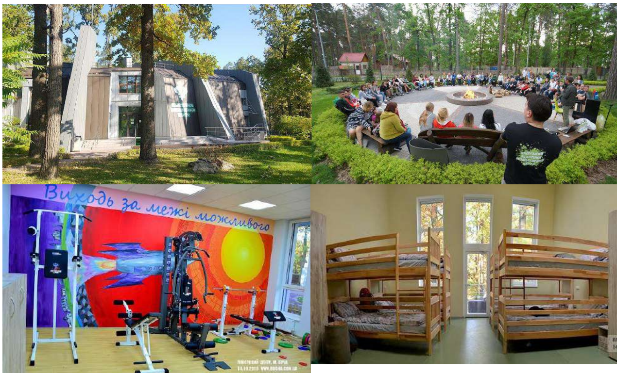
Рис. 2. Приклад місця для сталого пластового табору (м. Буча [7])