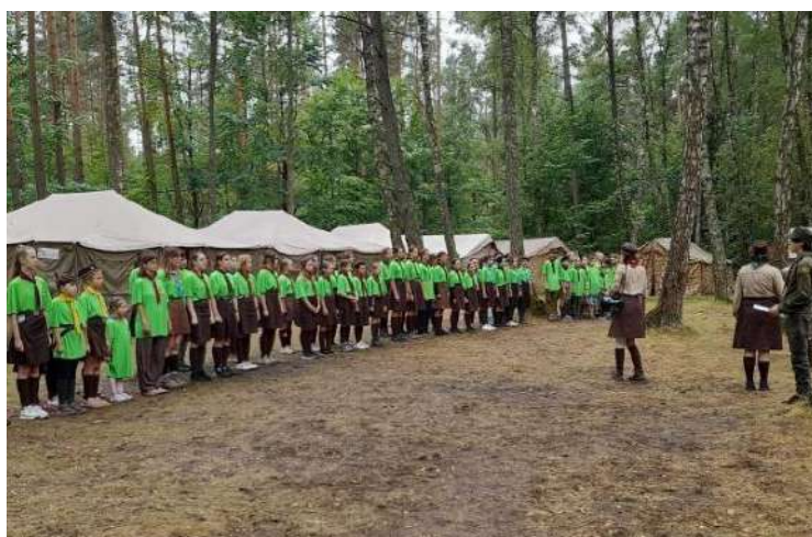
Рис. 3. Приклад кемпінгового виду пластового табору [7]

Вишкільні табори, згідно з дослідженнями О. Субтельного [9], передусім призначені для підготовки пластових виховників. Ці табори тривали зазвичай один тиждень і фокусувалися на теоретичних і практичних аспектах керування роєм чи гуртком.