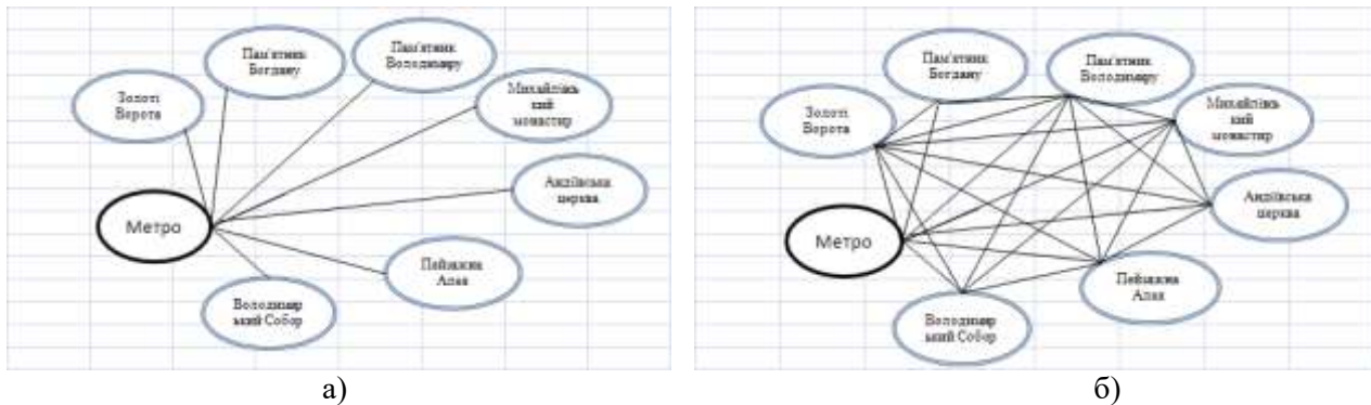
Рис. 1. Схематичне зображення можливих маршрутів, де а – можливі варіанти початку прогулянки; б – усі можливі варіанти

Так, на рисунку (див. рис. 1 а) зображено можливий вибір початку обходу. Як бачимо, відповідно до запланованих для відвідування місць існує сім варіантів того, як розпочати прогулянку (рис. 1 б). Отже, для того щоб розв'язати задачу методом перебору, потрібно розглянути 7! (усього 5040) допустимих розв'язків. Тут наголосимо, що застосування ІКТ робить цю процедуру здійсненною. Сформувані матрицю відстаней у таблиці MS Excel.