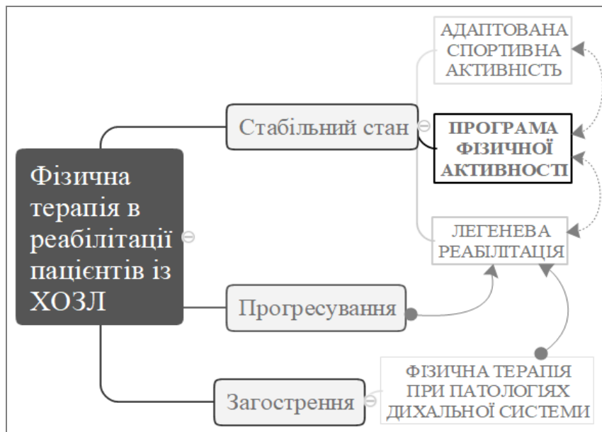
Рис. 2. Місце програм фізичної активності у фізичній терапії пацієнтів із ХОЗЛ

Згідно з висновками багатьох клінічних настанов, пацієнтам із ХОЗЛ потрібно підтримувати досягнуті ефекти амбулаторної терапії за допомогою виконання розроблених домашніх програм або завдяки збільшенню рівня своєї рухової активності [3]. Одним з основних завдань фізичної терапії з пацієнтами з ХОЗЛ є сприяння збільшенню їхньої фізичної активності та підтриманню фізичної активності на достатньому рівні після завершення програми легеневої реабілітації (рис. 2).