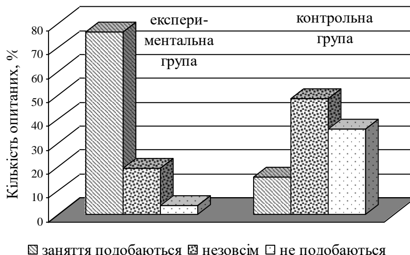
Рис. 2. Рівень задоволення студентів контрольної та експериментальної груп змістом занять із фізичного виховання

навчальних спортивно-оздоровчих центрів із секціями з видів спорту. Залучення студентів до занять видами спорту в позанавчальний час і можливість продовжувати їх у процесі обов'язкових занять із фізичного виховання в групах зі спортивною спрямованістю відіграли роль об'єднуючої ланки між навчальними й позанавчальними формами занять і підвищили обсяги рухової активності студентів.