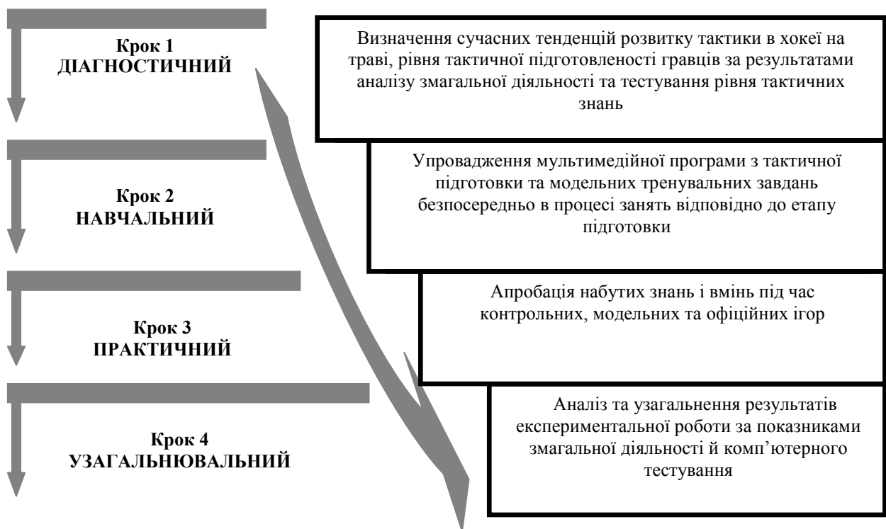
Рис. 2. Алгоритм реалізації моделі тактичної підготовки кваліфікованих хокеїстів на траві

Методику тактичної підготовки кваліфікованих хокеїстів реалізовано в такій послідовності педагогічних дій (рис 2.):